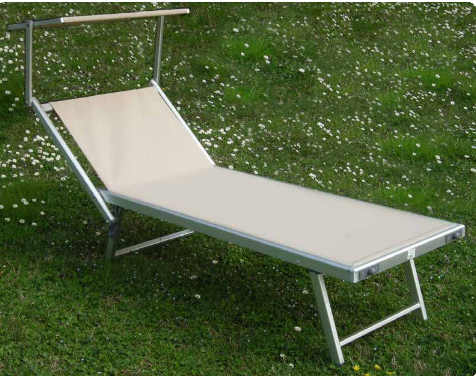
Ref. BP0030 LETTINO MIAMI